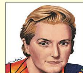
15. Rita Montagnana (1895-1979) Torinese, comunista