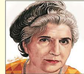
13. Angelina Merlin detta Lina (1887-1979) Padovana, socialista