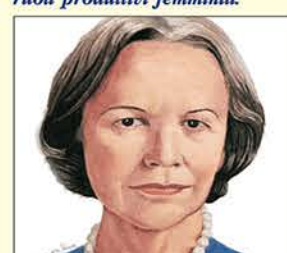
11. Nilde (Leonilde) Iotti (1920-1999) Emiliana, comunista