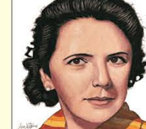
20. Maria Maddalena Rossi (1906-1995) Pavese, comunista

Costituente-Madre della Repubblica. Inizia a lavorare in fabbrica da bambina e partecipa subito alle lotte operaie contro la guerra. Iscritta al Partito Socialista, con la costituzione della Federazione giovanile socialista d'Italia (FGCI), e la scissione di Livorno, aderisce alla nuova formazione politica. Lavora nel partito con il futuro marito Luigi Longo, studente di ingegneria; viene inviata a Mosca per frequentare la scuola leninista, e rientrata clandestinamente organizza lo sciopero delle mondine. Partecipa alla guerra civile in Spagna, dove opera con lo pseudonimo di Estella. Nel '39, viene internata insieme al marito nel campo di concentramento di Ravensbrück. Nel '45 è nella Consulta nazionale e poi nella Commissione dei 75 alla Costituente. Chiede di specificare tra assistenza e previdenza; la separazione da Longo, che apprende dalle pagine del Corriere della Sera, la allontana dalla vita politica, ma continua a combattere sempre in favore della parificazione dei sessi. Potere: La fede negli ideali. Violenza: La lotta per il cambiamento. Legalità: L'impegno per uno stato sociale.