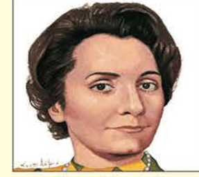
14. Angiola Minella (1920-1988) Torinese, comunista