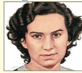
12. Teresa Mattei (1921-2013) Genovese, comunista