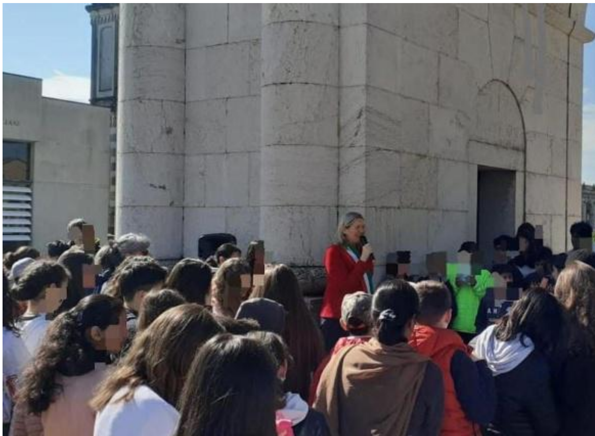
Gli studenti delle scuole elementari e medie di Luzzara impegnati nel progetto «Costituzione vissuta»

accompagnati dalla scrittrice Chiara Colombini che ha poi presentato il libro 'Storia passionale della guerra partigiana' in un incontro in biblioteca, organizzato dall'Anpi. A Luzzara, inoltre, gli studenti sono molto coinvolti in un altro progetto, legato alla cura di un parco dedicato ai venti bambini vittime di torture alla scuola di Bullenhuser Damm, ad Amburgo, in Germania, nel 1945, tra questi anche l'italiano Sergio De Simone. A loro è dedicato uno spazio fiorito del parco, la cui manutenzione è affidata proprio ai bambini delle scuole locali. Si tratta di rose bianche al parco Primo Levi di via San Martino. Il dottor Mengele, medico di Auschwitz che condusse esperimenti sui deportati, nel novembre 1944 cercò nella baracca 11, destinata ai bambini, venti piccoli da inviare a Neuengamme, un campo di concentramento a sud-est di Amburgo, dove il dottor Kurt Heissmeyer li avrebbe usati come cavie per sperimentazioni sulla tubercolosi. Le torture durarono fino al 20 aprile 1945 quando, con gli inglesi alle porte, i nazisti cercarono di cancellare ogni traccia: i bambini vennero trasportati nella scuola per essere uccisi. Un episodio su cui gli alunni luzzaresi hanno svolto ricerche e approfondimenti.