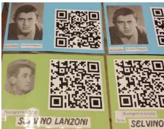
I Qr Code realizzati dai ragazzi e posti nei luoghi chiave del paese: contengono letture e storie a fumetti

storia viene esaminata con il passato di una persona. In questo caso, gli studenti luzzaresi hanno deciso di guardare al futuro, a quella che sarebbe potuta essere la vita dei personaggi esaminati, presi in considerazione